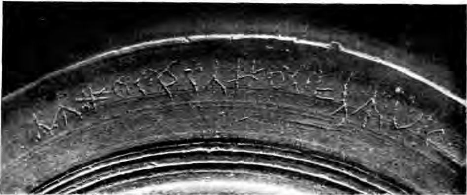
Рис. 2. Надпись на баклажке Новочеркасского музея

Пожалуй, наиболее ранний экземпляр таких сосудов происходит из раннесредневекового слоя Мирмекия на Керченском полуострове. Он имеет вид каравай хлеба или, точнее, шарового сегмента. Баклажки Новочеркасского музея имеют форму низкого цилиндра, высотой не более 8 сантиметров при диаметре 30—35 сантиметров. Наружная, лицевая