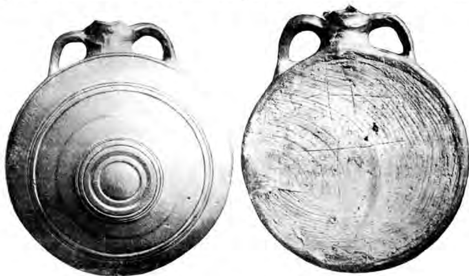
Рис. 1. Баклажка Новочеркасского музея а — лицевая сторона; б — оборотная сторона

В Новочеркасском музее давно уже хранится баклажка с рунической надписью по верхнему краю ее лицевой стороны (рис. 1, а и б; рис. 2). Хотя надпись эта состоит не менее чем из 16 знаков, все попытки дешифровки ее оканчивались неудачей. Во время Великой Отечественной войны,