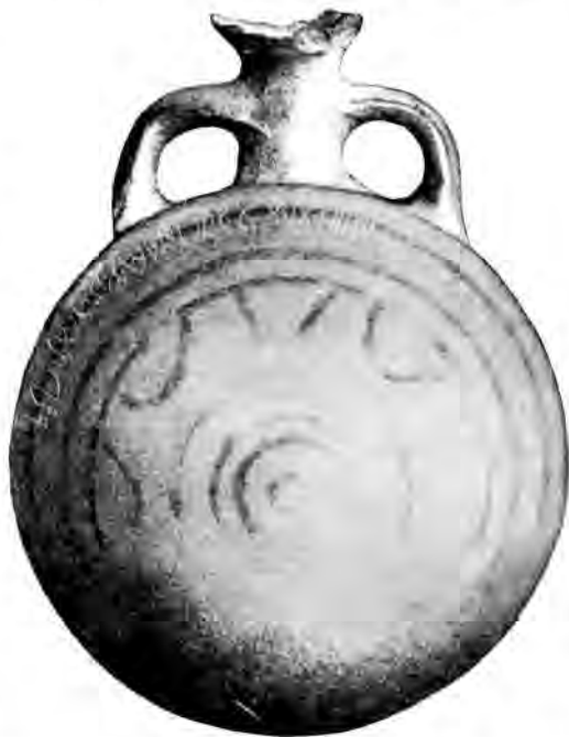
Рис. 3. Баклажка из станицы Кривянской

Основываясь на сопоставлениях некоторых деталей, формы и техники изготовления баклажек Новочеркасского музея с другими датированными сосудами, я считал бы возможным отнести их к IX—X вв., т. е. ко времени, когда еще продолжалось начавшееся в VII в. хазарское господство в степях юго-востока Европейской части СССР. Очевидно, тем же временем надо датировать и надписи на баклажках. Подтверждением указанной датировки может служить близко сходная баклажка, найденная в Подгоровском могильнике в погребении с инвентарем салтовского типа 1 . Еще более сходная с новочеркасскими баклажка была найдена в могильнике Horgos и опубликована Хампелем 2 . Она также украшена концентрическими кругами с полосами волнисто-линейного орнамента между ними. Могильник Horgos содержит погребения разного времени: наряду с захоронениями аварского периода здесь имеются и более поздние, относящиеся к X—XI вв. Интересующая нас баклажка, к сожалению, не связывается с определенным погребением и поэтому не может быть датирована по сопровождающим ее находкам.