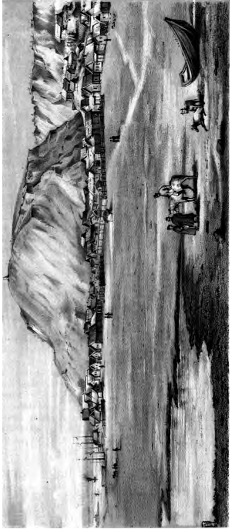
Рис. съ натури от Н. Шамановъ.